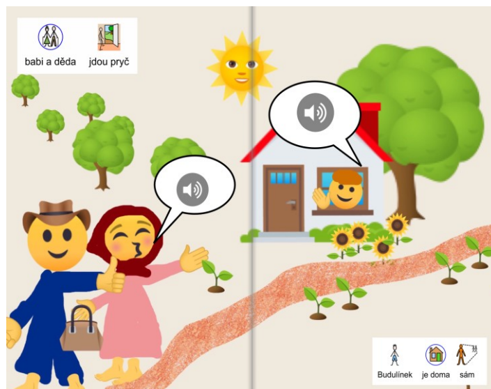
Obr.3: Adaptovaná ozvučená knížka, vytvořená v aplikaci Book Creator

opravdu každý. Společná tvorba je velkým motivačním faktorem a i malé děti se na ní mohou s úspěchem podílet. Od nahrávání citoslovců (například zvuků zvířátek) k obrázkům, jednoslovnému pojmenování až k ozvučeným hotspotům s krátkým slovním spojením. Využít můžeme obrázky z klasických pohádek, vlastní příběhy ve fotografiích, screeny dějových situací z oblíbených aplikací, kresby, emotikony atd.