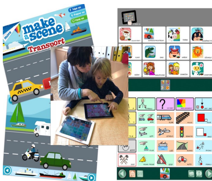
Obr.3: Interaktivní aplikace s klasickou komunikační stránkou (“low-tech”)

Obrácenou možnost nabízejí dějové aplikace, ve kterých děti mohou vytvářet a měnit různé situace. Zařídit domeček, zabydlet je členy rodiny, vařit, nakupovat, hrát si na kadeřníka, stát se strojevodcem a řídit vlak atd. Připravenými komunikačními stránkami lze i tady rozvíjet jádrovou slovní zásobu i tematické okruhy.