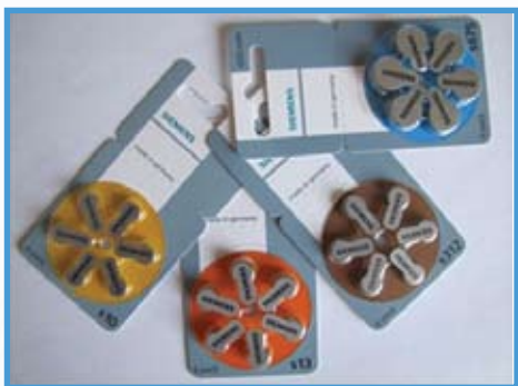
Baterie Siemens - typ 10, 13, 312, 675