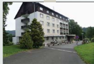
Jetřichovice, hotel Bellevue